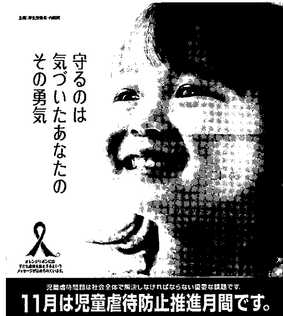
図1 「児童虐待防止推進月間」標語

どころか、児童相談所に届けられた児童虐待数は、平成22年度には5万件を超え、増加の一途をたどっている。詳細は、図2に示した。虐待者の内訳をみると、驚くことに、実の父母が増加してきており、一層子育て支援への課題が大きい。